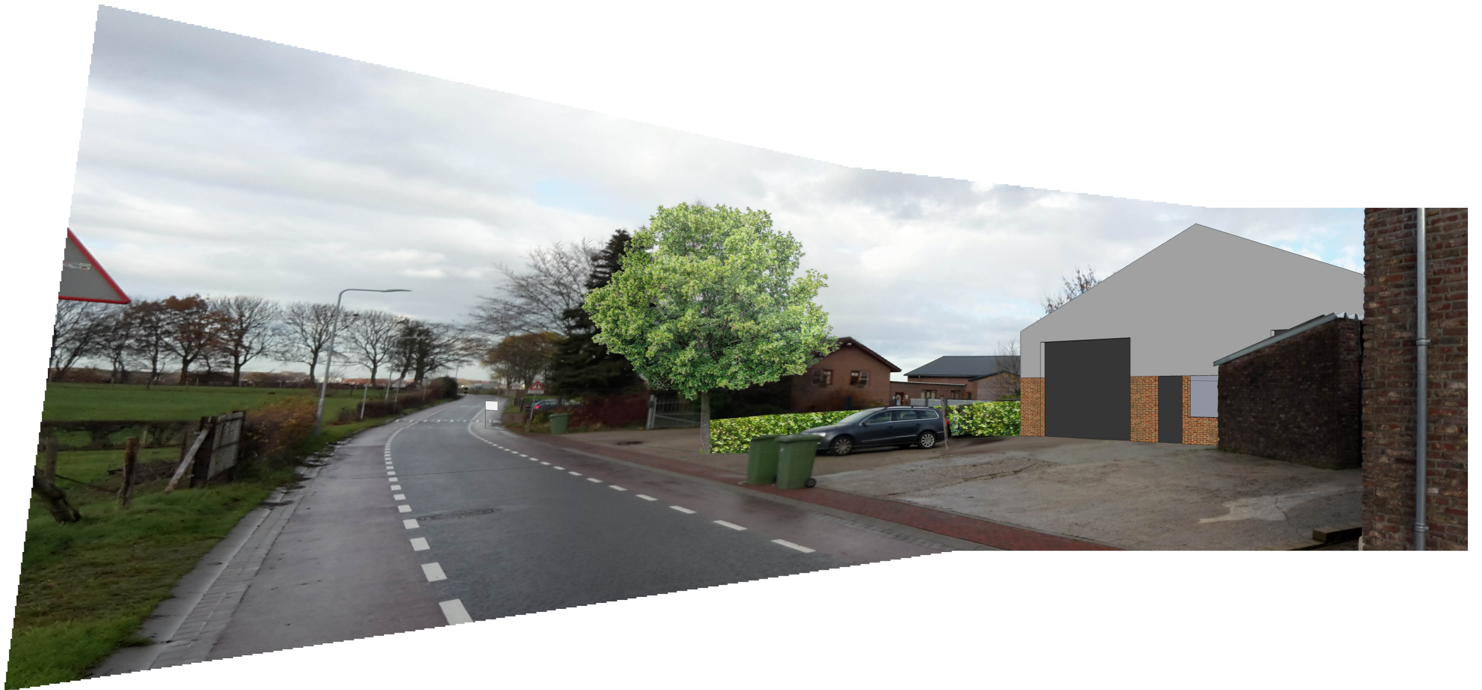
Aanzicht beoogde situatie vanuit het oosten