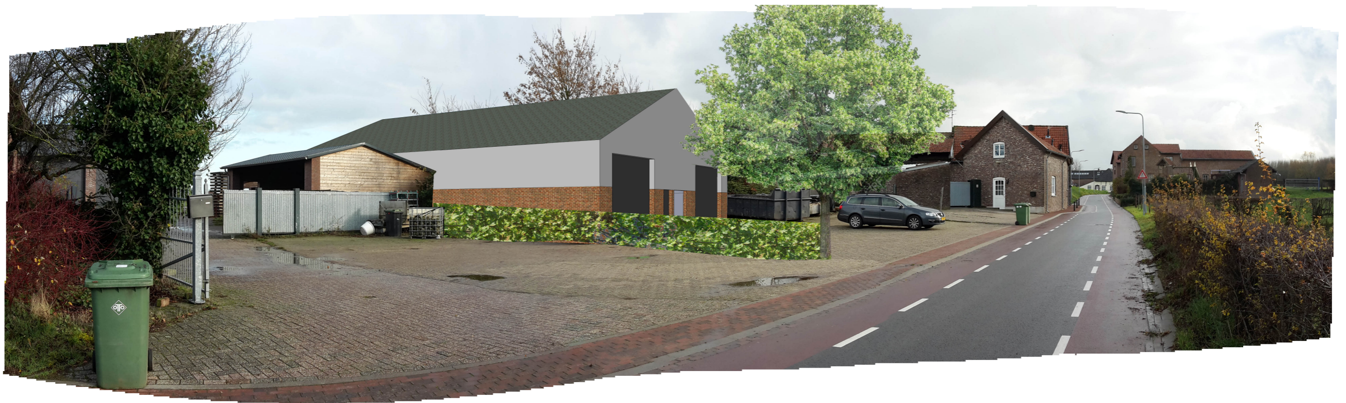
Aanzicht beoogde situatie vanuit het westen