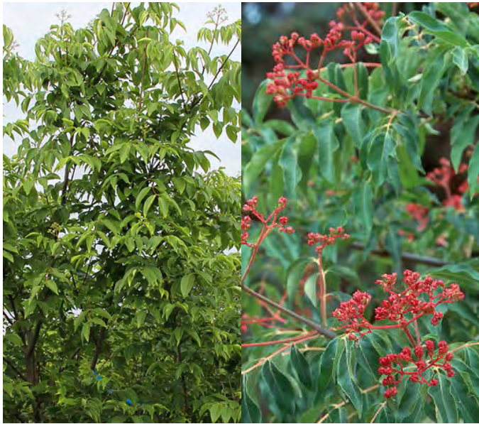
Tetradium daniellii (Bijenboom)