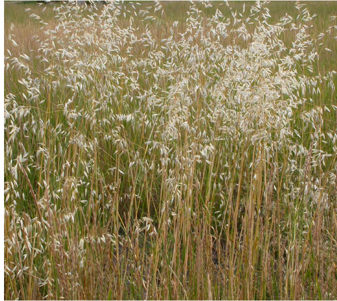
Avena fatua (Wilde haver)