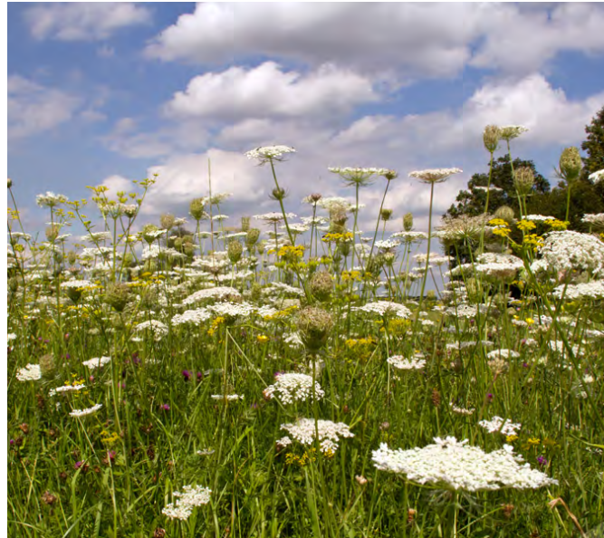
Daucus carota (Wilde peen)