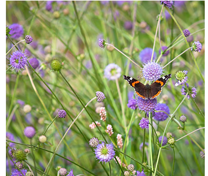
Succisa pratensis (Blauwe knoop)