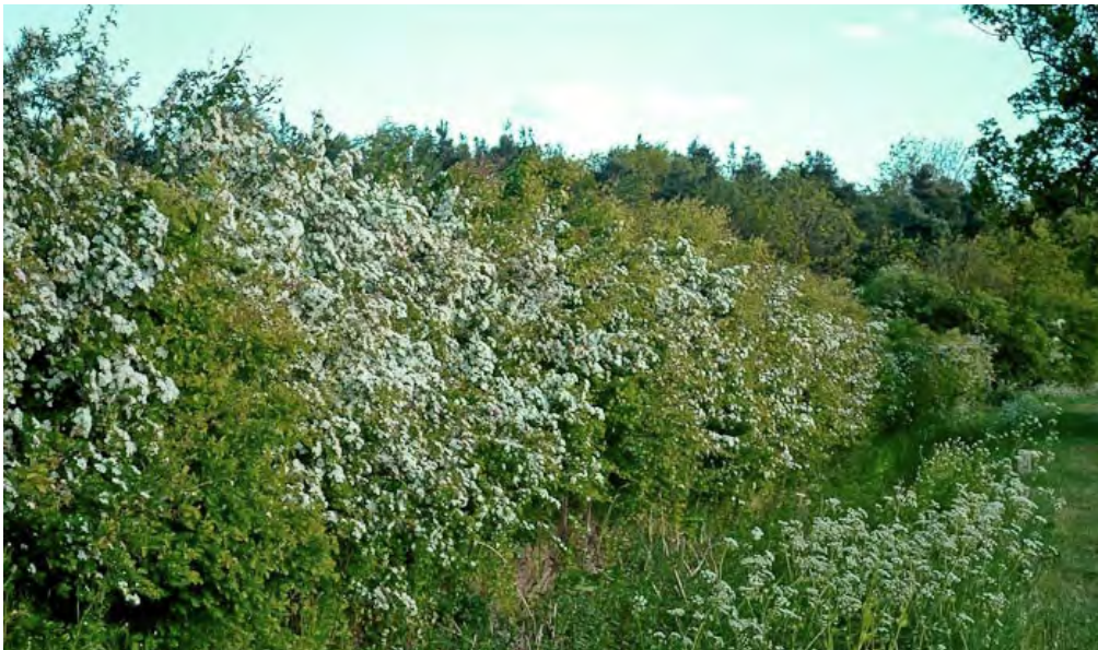
Struweel tussen de zonneweide en de boomgaard