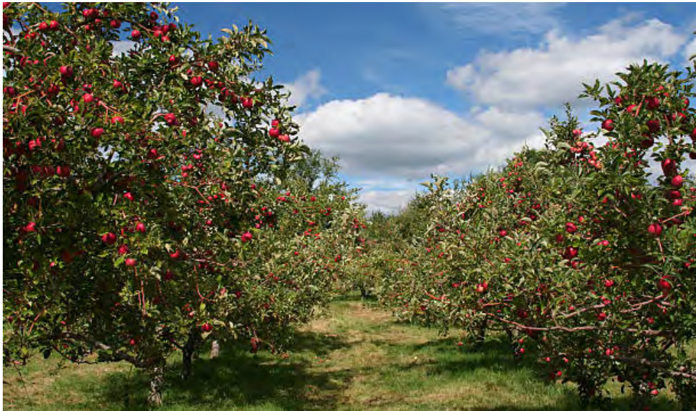
Boomgaard met Malus domestica en Prunus domestica