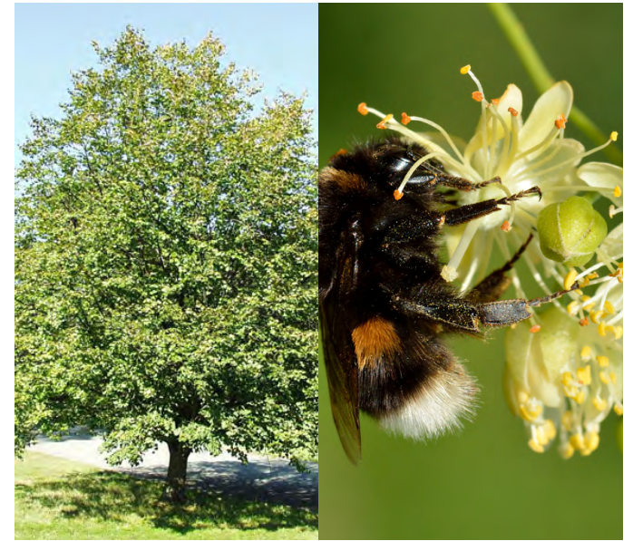
Tilia cordata (Winterlinde)