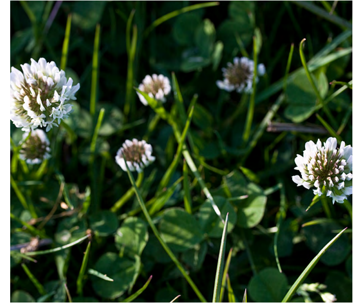
Trifolium repens (Witte klaver)