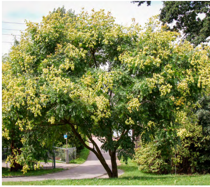
Koelreuteria paniculata (Chinese vernisboom)