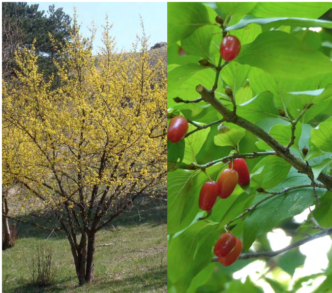
Cornus mas (Gele kornoelje)