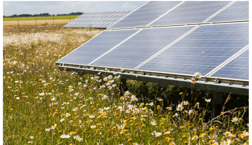
Zonnepanelen in bloemrijk grasland