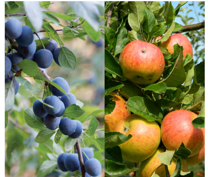
Boomgaard: Prunus en Malus (soort n.t.b.)