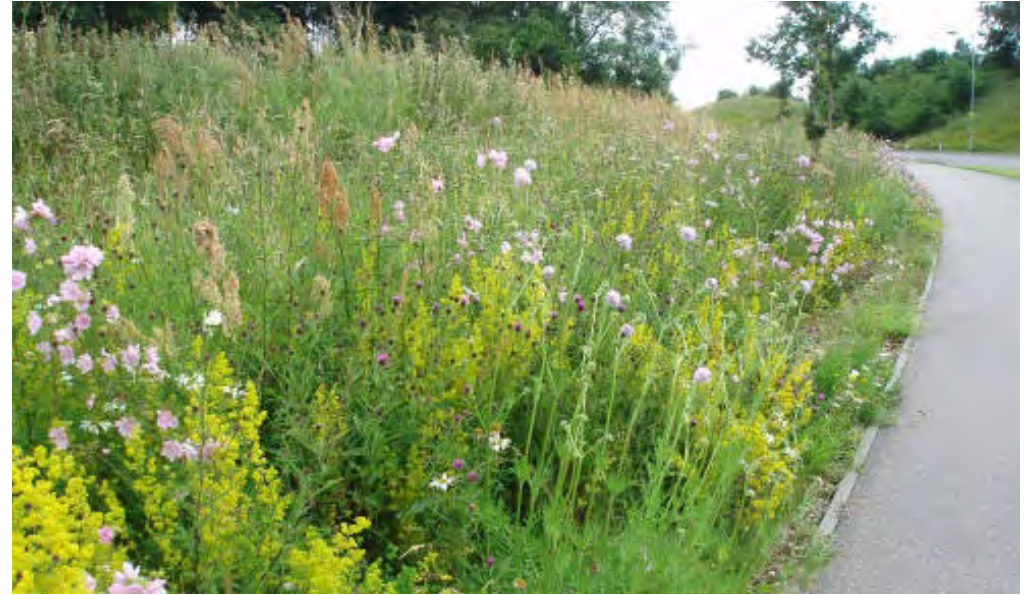
Bloemrijke berm (soorten die bijen aantrekken)