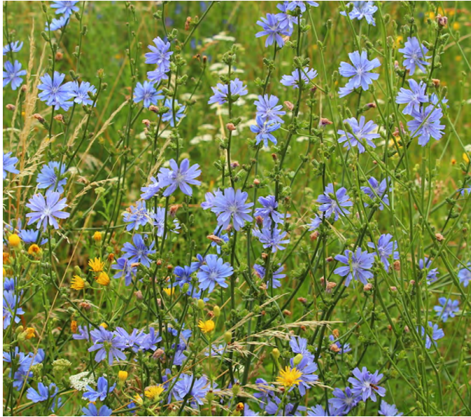
Cichorium intybus (Wilde cichorei)