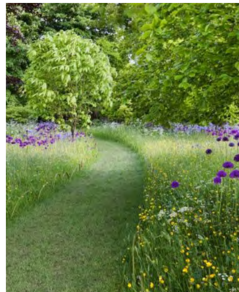
Graspad tussen boomgaard