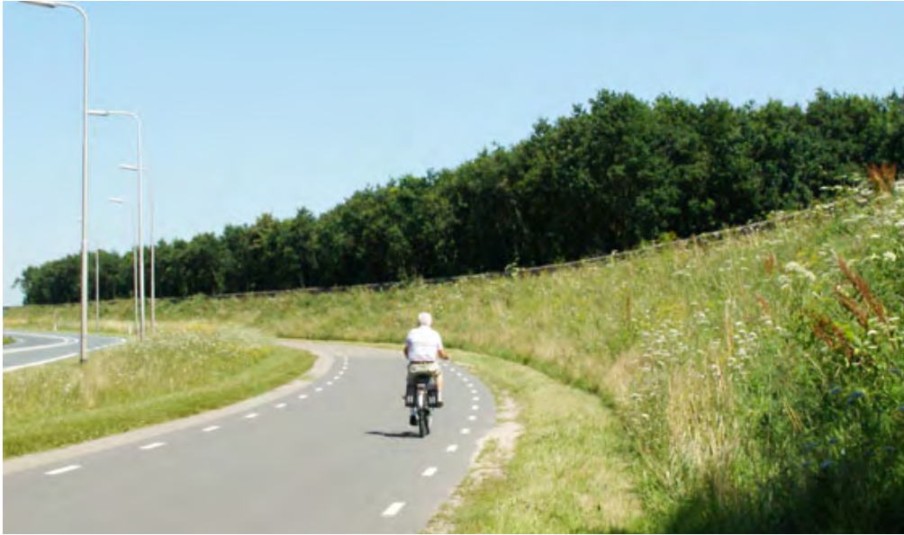
Mooi ingeplante wal langs de N274